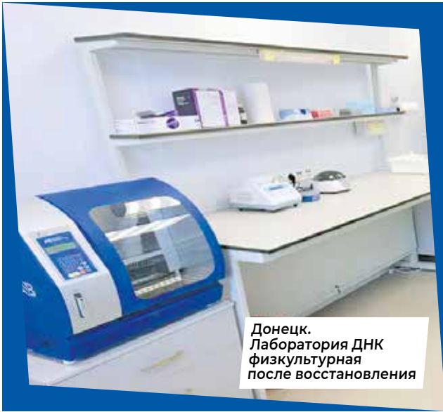
Донецк. Лаборатория ДНК физкультурная после восстановления

два объекта здравоохранения в Волновахе и Докучаевске, многофункциональный медицинский центр в Мариуполе, завершим строительство Донецкого перинатального центра, реконструируем протезно-ортопедический центр и построим госпиталь — тоже в Донецке. Также построим филиал Нахимовского военно-морского училища, школу и детский сад в Мариуполе, три современных площадки для детей в Шахтерске и три объекта спорта в Зуевке и Троицко-Харцызске.