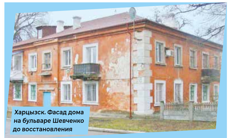
Харьківськ. Фасад дома на бульварі Шевченка до відновлення

— Да, с помощью регионов в этом году мы планируем восстановить 1 615 объектов. Среди них 84 дороги, 9 мостов, 91 школа, 63 детских сада, 32 лечебных учреждения, 44 многоквартирных жилых дома, 16 объектов культуры, 8 — спорта. И это только часть программы восстановления. Помимо этого, мы построим