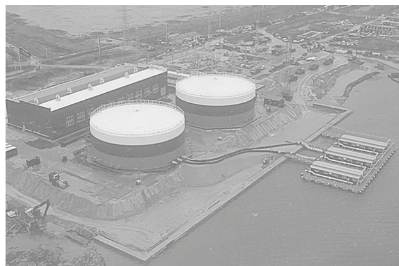
Водовод и плавучая насосная станция

«Даже во времена всесоюзных строек в СССР на создание такого водовода уходило до 5 лет. Наша стройка стартовала в декабре 2022-го, а сегодня уже включилась первая насосная станция», – подчеркнул он.