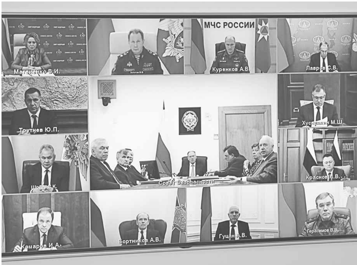
Участники заседания Совета Безопасности Российской Федерации

Владимир Путин отметил, что обстановка в новых субъектах остается напряженной из-за артобстрелов со стороны ВФУ и постоянных терактов. Лидер России подчеркнул,