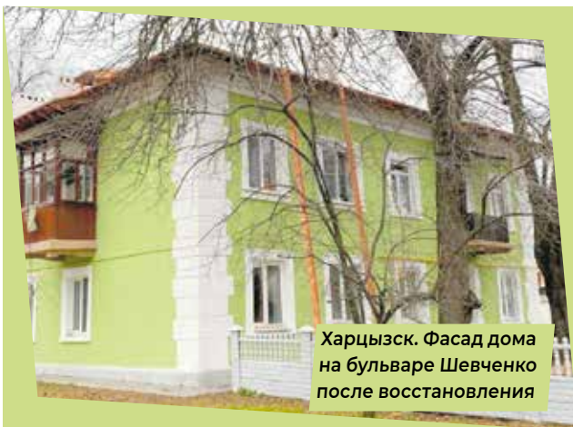
Харцызск. Фасад дома на бульваре Шевченко после восстановления

— ДНР примет участие в Международной выставке-форуме «Россия». Какие перспективы откроются там для наших предприятий?