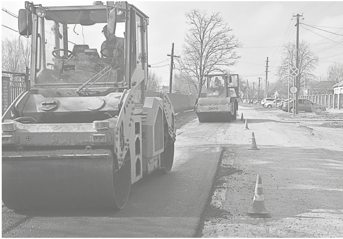
Замена асфальта на дорогах Енакиево

Специалисты также занимаются восстановлением жилых домов. Так, в одном из объектов уже