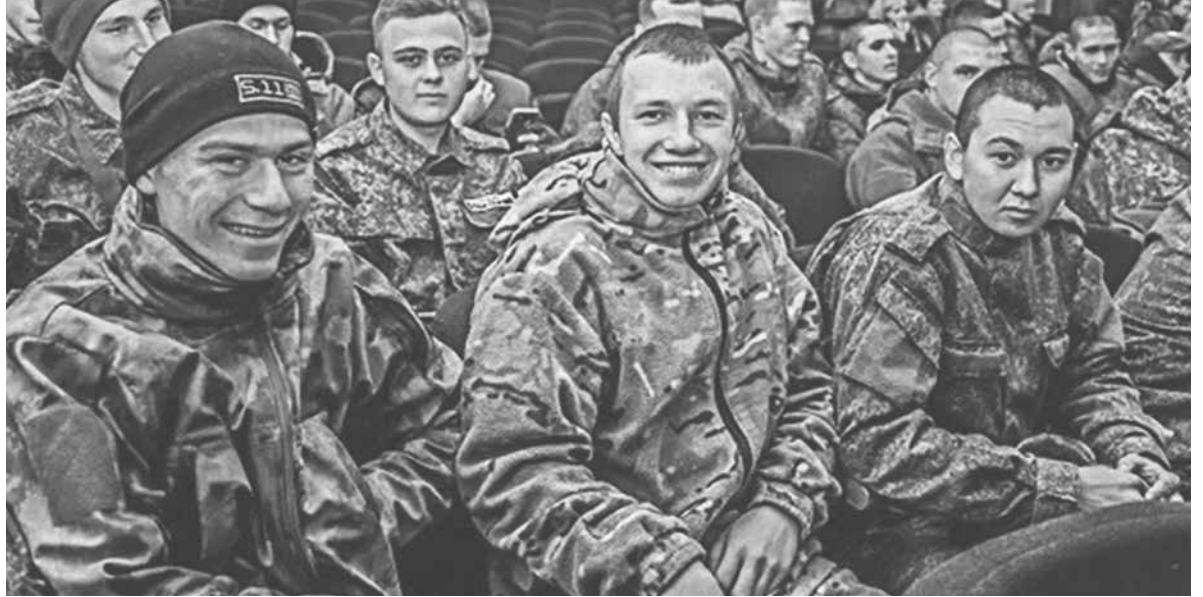
Участники СВО – демобилизованные студенты из ДНР

Владимир Путин поручил Правительству РФ в месячный срок утвер-