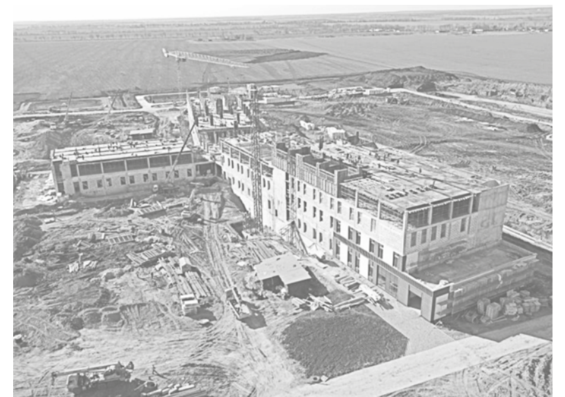
Работа на объекте кипит круглые сутки

По словам инженера Военно-строительной компании Дмитрия Шукмана, специалисты медцентра будут оказывать помощь не только жителям ДНР, но и гражданам из соседних регионов страны. «В первом этапе строительства предусматривается до 20 реанимационных палат и 40 палат общего пользования. Во втором этапе запланировано возведение здания стационара на 333 койки», – рас-