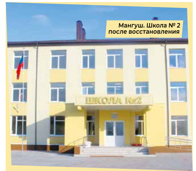
Мангуш. Школа №2 после восстановления

Как наиболее вероятные рассматриваются такие маршруты как Донецк — Ростов-на-Дону, Донецк — через Дебальцево, Луганск, Счастье, Старобельск — на Валуйки Белгородской области и далее в сторону столиц. Прорабатывается и короткий маршрут в Крым: Донецк — Волноваха — Мелитополь и затем на полуостров. Но пока это невозможно из-за прохождения магистрали на некоторых участках вдоль линии соприкосновения, как в районе той же Авдеевки или Еленовки.