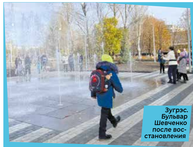
Зугрэс. Бульвар Шевченко после восстановления

— Да, к сожалению, некоторые шахты Донбасса по ряду объективных причин, в том числе из-за обстрелов, прекратили угледобычу. Естественно, мы ищем инвесторов, чтобы возобновить их работу. Или другие решения. Совсем недавно поступили очень интересные предложения от специалистов из Кузбасса, и в скором времени мы их рассмотрим.